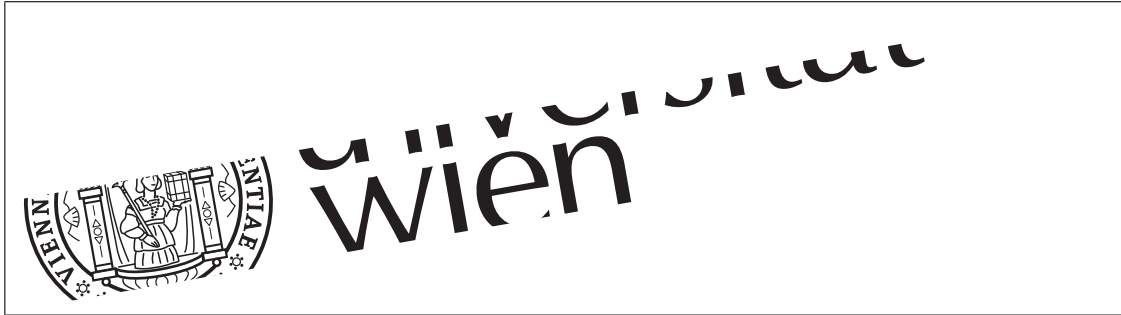
Abbildung 1: Legende zur Abbildung. You some features of the includegraphics command here. For clipping, give a “viewport” in case of PDF and a “bb” for the case of PS. Use ghostview to see coordinates you want to clip. You don’t need to make a framed box around your figure, that’s only for illustration.

Nulla malesuada porttitor diam. Donec felis erat, congue non, volutpat at, tincidunt tristique, libero. Vivamus viverra fermentum felis. Donec nonummy pellentesque ante. Phasellus adipiscing semper elit. Proin fermentum massa ac quam. Sed diam turpis, molestie vitae, placerat a, molestie nec, leo. Maecenas lacinia. Nam ipsum ligula, eleifend at, accumsan nec, suscipit a, ipsum. Morbi blandit ligula feugiat magna. Nunc eleifend consequat lorem. Sed lacinia nulla vitae enim. Pellentesque tincidunt purus vel magna. Integer non enim. Praesent euismod nunc eu purus. Donec bibendum quam in tellus. Nullam cursus pulvinar lectus. Donec et mi. Nam vulputate metus eu enim. Vestibulum pellentesque felis eu massa.